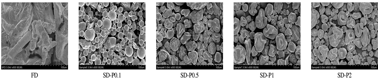
Fig. 1. Scanning electron microscopic photographs of spray-dried pumpkin sweet potato hydrolysates (magnification ×500).

호박고구마 효소 분해물 분무건조 분말의 수율, 수분함량 및 전분함량은 Table 3과 같다. 호박고구마 효소 분해물의 수율은 동결건조 분말의 경우 90.27%였고 분무건조 분말은 72.68-87.12%였다. 수분함량은 동결건조 분말의 경우 2.67%를 나타내어 분무건조 분말 1.68-2.46%에 비해 높은 함량을 나타내었다. 이는 분무건조 분말 제조를 위한 분무건조 공정에서 가열 온도가 증가하면 열전달 효율성의 증가로 인해 수분함량이 감소한다는 연구보고와 일치하였으며(19), Kwon 등(20)의 건조방법에 따른 칩 추출물의 품질특성에서 분무건조 분말에서 동결건조 분말에 비해 낮은 수분함량을 나타낸다고 보고하여 본 연구결과와 유사한 결과를 나타내었다. 전분함량은 분무건조 분말에서 45.32-46.51%의 함량을 나타내어 동결건조 분말 41.06%에 비해 전반적으로 함량이 증가하는 경향을 나타내었다. 이는 Lee(21)의 가열처리가 잡곡류의 전분가수분해율에 미치는 영향에 대한 연구에서 원곡에 비해 가열처리하였을 때 전분 함량이 증가하였는데 이는 가열처리에 의해 수용성 성분이 유출됨에 따라 전분 함량이 높아졌기 때문이라 보고하여 본 연구에서도 분무건조 공정에 의해 전분함량이 증가한 것으로 사료된다.