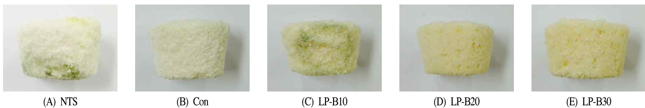
Fig. 3. Observation of rice cake ( Baekseolgi ) produced during the storage for 6 days at room temperature (25°C).

NTS, rice flour 100%; Con, spray-dried rice flour 100%; LP-B10, add with rice flour included L. plantarum CGKW3 by spray-drying 10%; LP-B20, add with rice flour included L. plantarum CGKW3 by spray-drying 20%; LP-B30, add with rice flour included L. plantarum CGKW3 by spray-drying 30%.