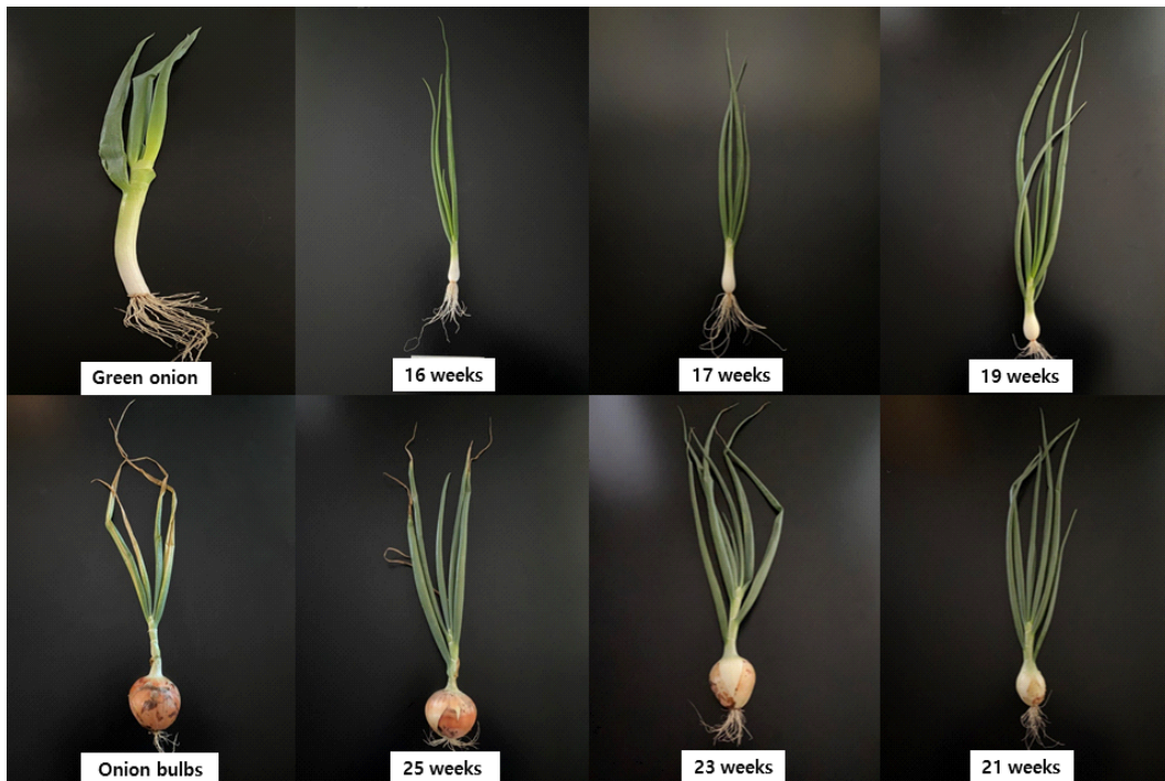
Fig. 1. The appearance of green onion and whole onion by growth stage. The harvesting time of growth stage is that 16 weeks is the 3rd week of March, 17 weeks is the 4th week of March, 19 weeks is the 2nd week of April, 21 weeks is the 4th week of April, 23 weeks is the 2nd week of May, 25 weeks is the 4th week of May, and onion bulb is 1st week of June.